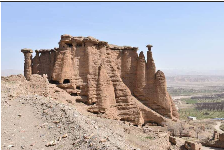
تخت دیو یا قلعه بهستان