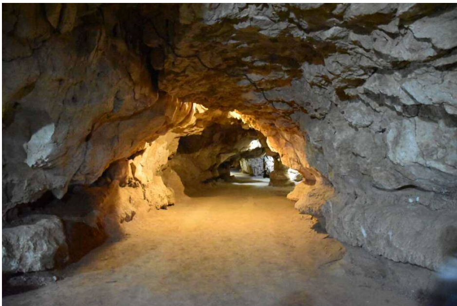
غار کتله خور