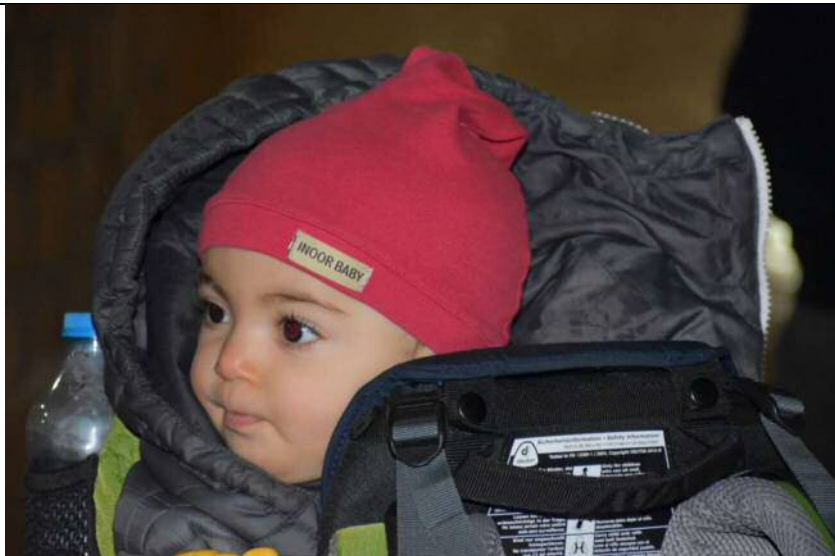
کوچکترین عضو گروه بهار آشتیانی