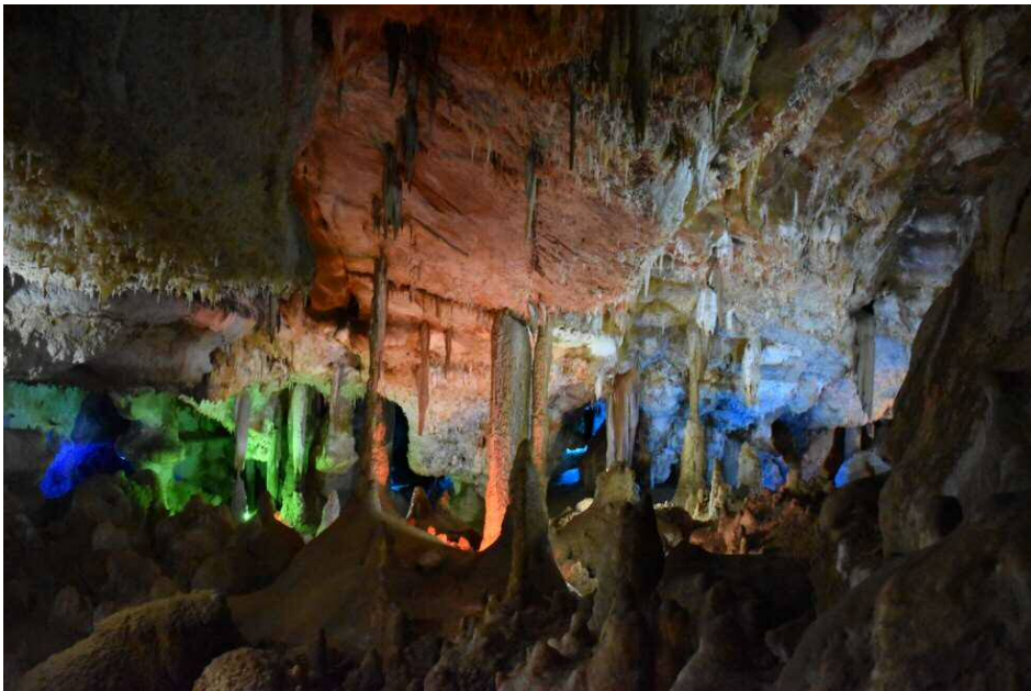
غار کتله خور