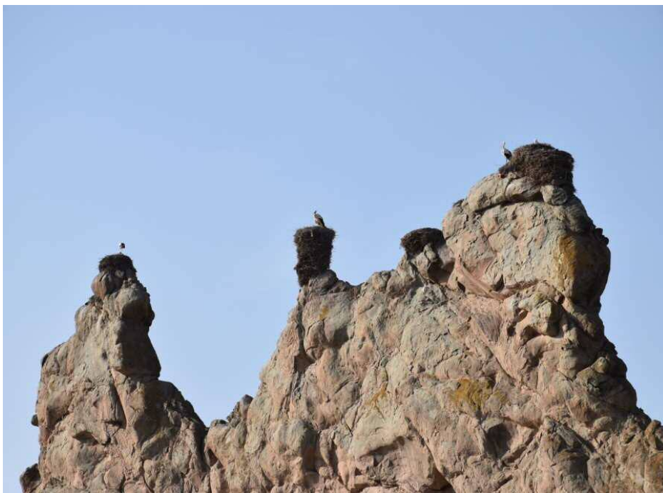
قلعه لک لک ها روستای شکورچی